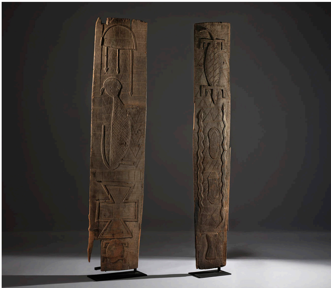
Dos paneles de una puerta de casa de alto rango. Cultura nupe. Nigeria. Finales del siglo XIX. Madera con fuerte pátina de oxidación, 208 x 48 x 1,5 cm / 208 x 34 x 1,5 cm.