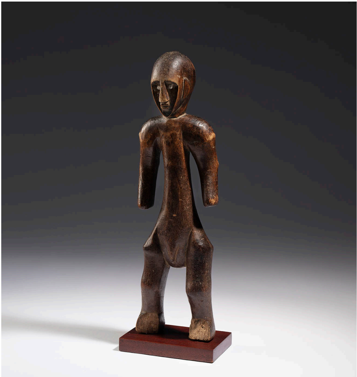
Representación de personaje masculino. Cultura bambara. Mali. Siglos XIX - XX. Madera con muy fuerte pátina de uso, 40 x 11,5 x 8 cm.