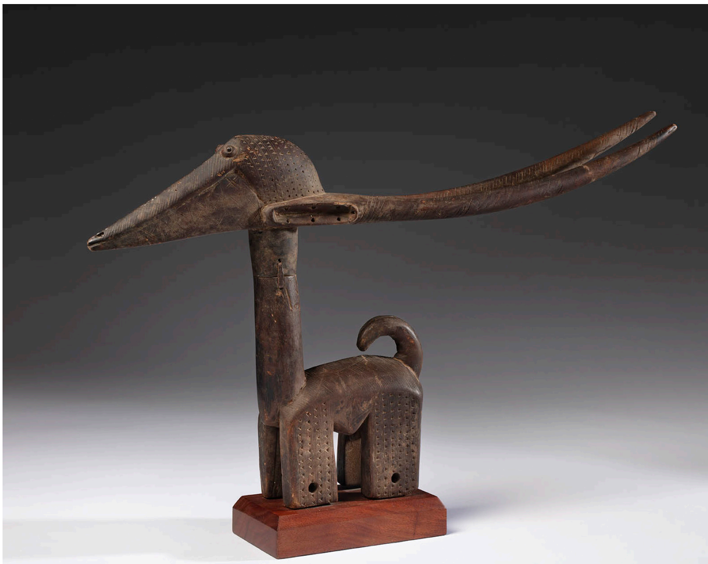
Cimera para la danza tywara . Cultura bambara. Mali. Finales del siglo XIX - principios del siglo XX. Madera con pátina de uso, 42 x 67 x 7 cm.