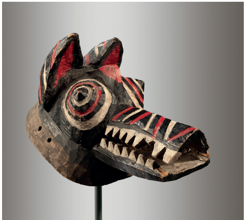
Copia de una máscara zoomorfa de los bobo de Burkina Faso. S/f. Madera pintada, 35 x 16 x 18 cm.

La mayor parte de las copias presentes en la exposición pueden situarse en el país de origen de su original correspondiente. Cuando se ha podido establecer un origen geográfico diferente se ha detallado así en la descripción.