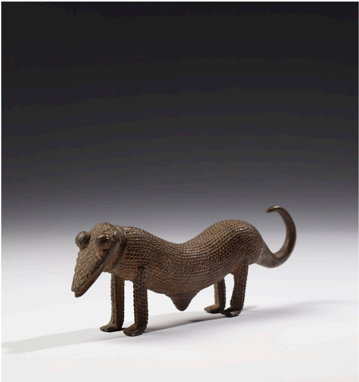
Probable representación de un pangolín. Cultura gan. Burkina Faso. Siglos XIX - XX. Bronce con pátina ligera de oxidación, 6 x 19 x 3,5 cm.