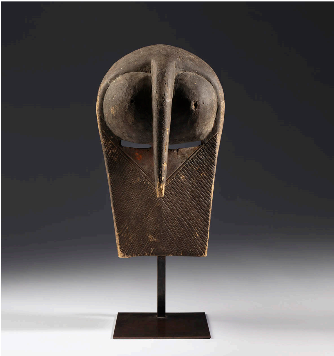
Máscara del tipo kifwebe representando un búho. Cultura songye o luba. República Democrática del Congo. Primera mitad del siglo XX. Madera y pigmentos, 33 x 19 x 16 cm.