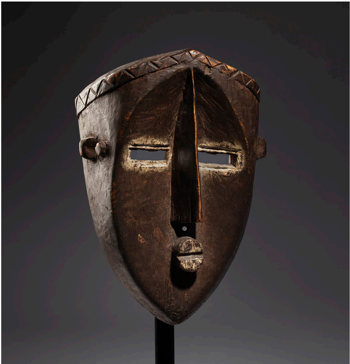
Máscara facial. Cultura kuba. República Democrática del Congo. Primer tercio del siglo XX. Madera y restos de tejido vegetal, 28 x 20 x 13 cm.