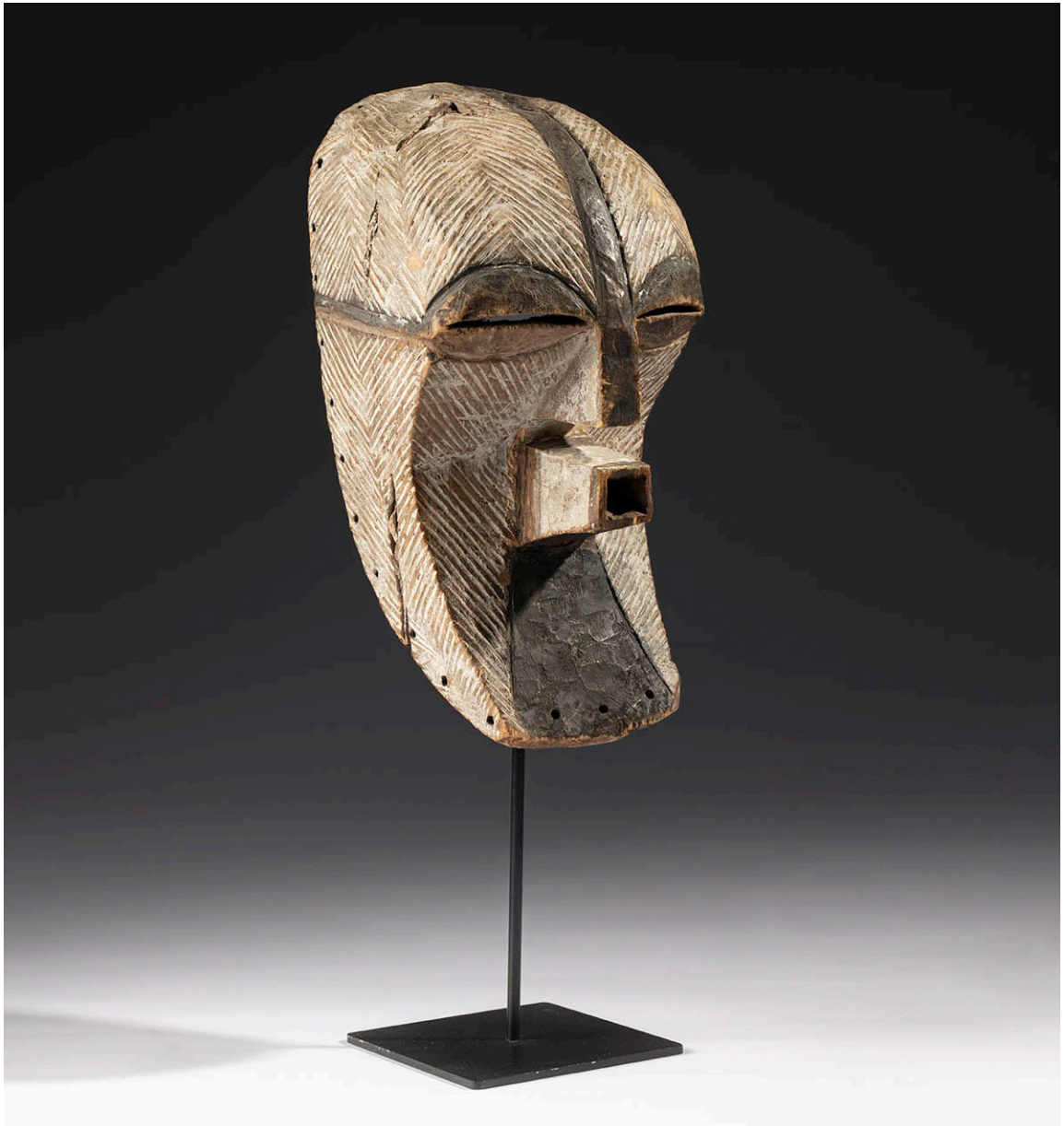
Máscara masculina del tipo kifwebe mostrando escarificaciones. Cultura songye. República Democrática del Congo. Primera mitad del siglo XX. Madera y pigmentos, 42 x 20 x 19 cm.