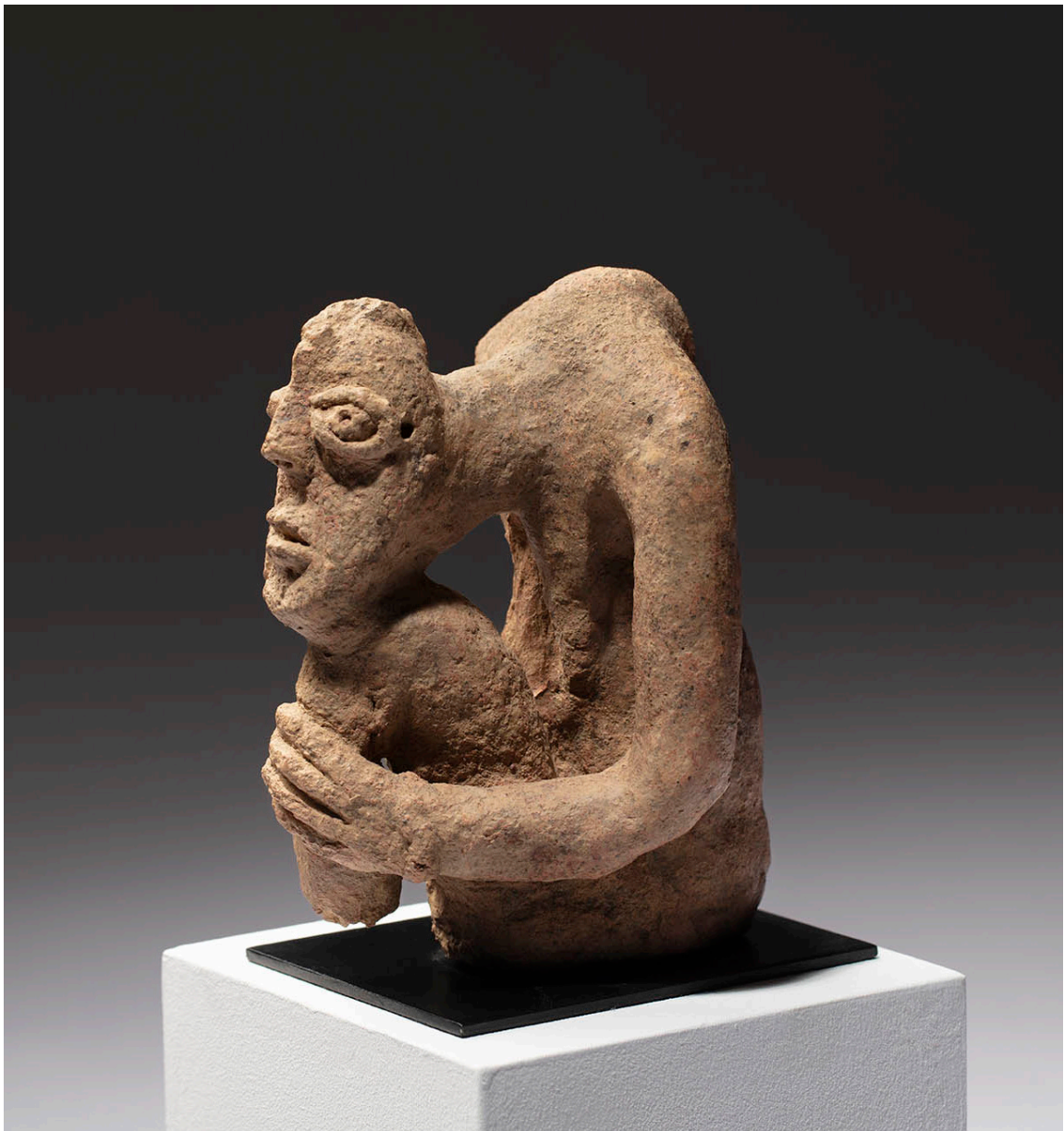
Pensador. Cultura de Djenné. Mali. Siglos XII - XVI. Terracota, 17 x 12 x 14 cm.