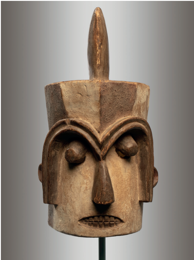
Copia de una máscara-casco de los kota de Gabón. S/f. Madera y pigmentos, 39 x 20 x 15,5 cm.