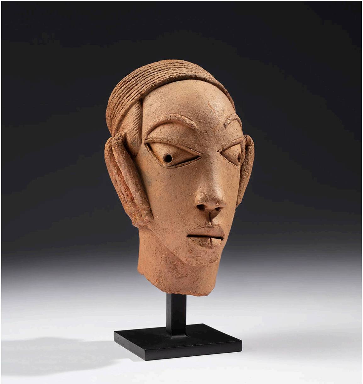
Cabeza de un personaje. Cultura de Nok. Nigeria. Siglos I - V. Terracota, 23 x 16 x 16 cm.