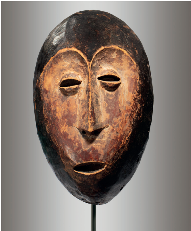
Copia de una máscara de los lega de la República Democrática del Congo. S/f. Madera y pigmentos, 27 x 17 x 8 cm.