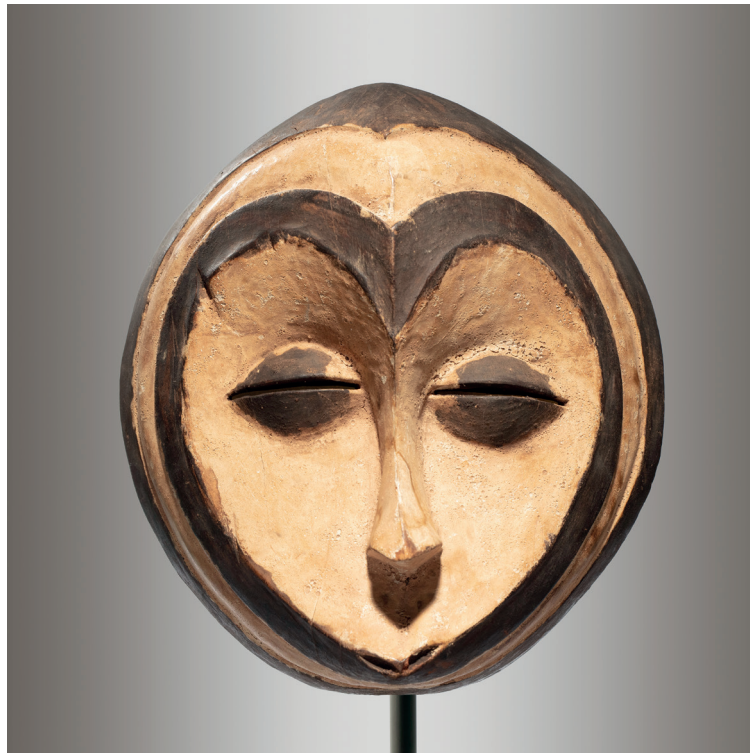
Copia libre de una máscara de los kwele de Gabón. S/f. Madera y pigmentos, 28 x 27 x 9,5 cm.