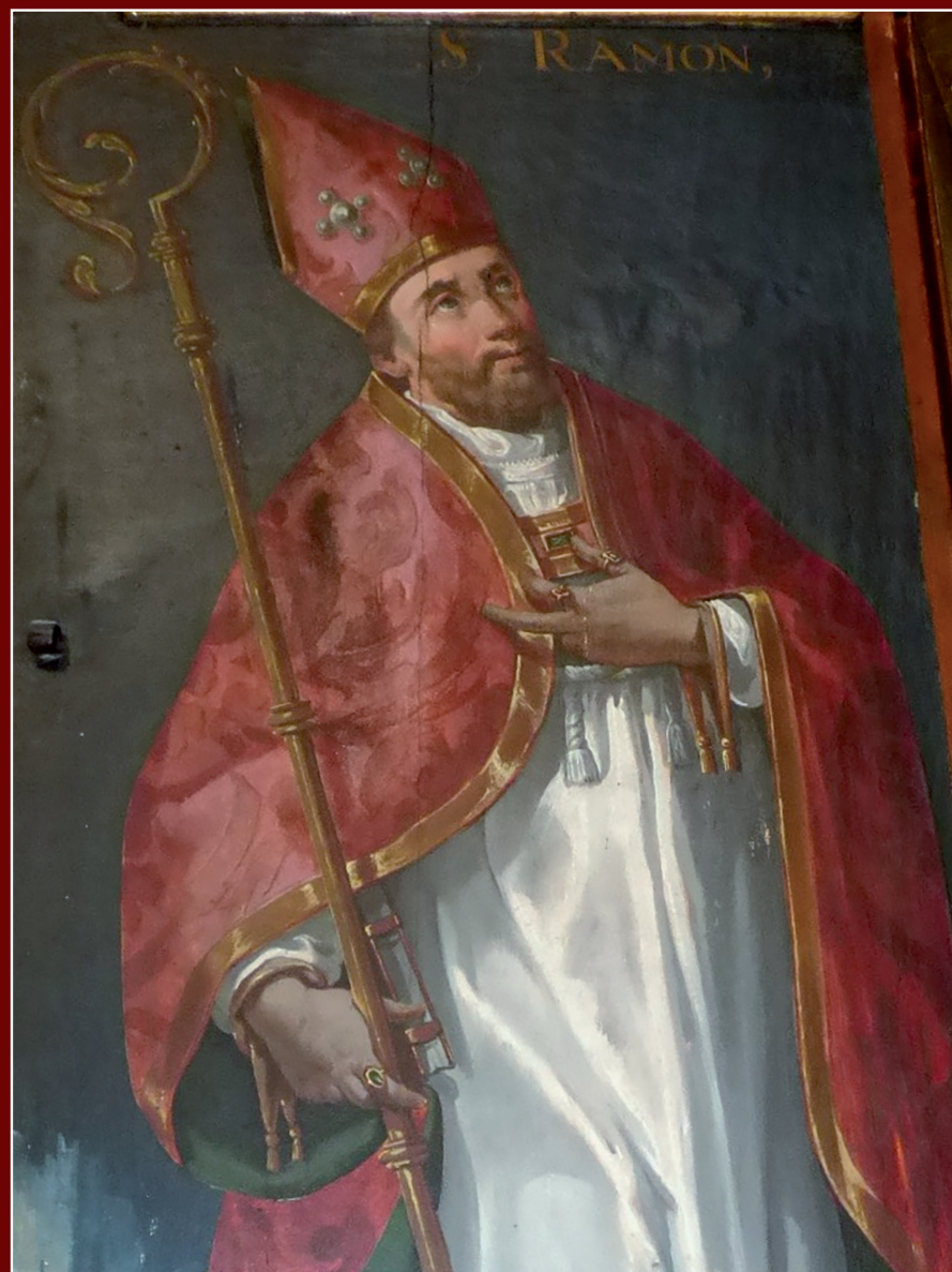
San Ramón en la capilla de San Nicestrato, en la colegiata de Alquézar. Obra de autor desconocido, finales de 1600